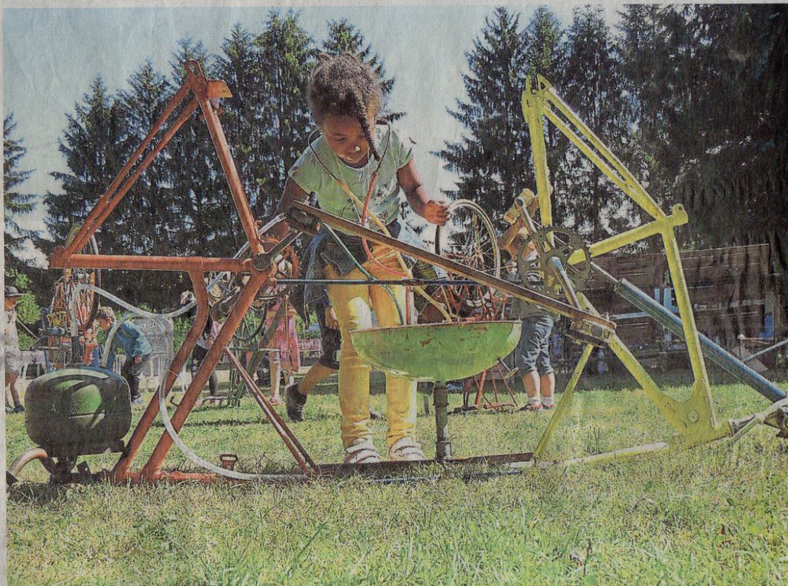
Les Cyclophones de François Cys sont à la portée des plus jeunes enfants dans le parc du jardin du Musée des beaux-arts.

Le festival réserve quelques espaces un peu excentrés pour que les jeunes enfants puissent eux aussi participer à la fête sans être noyés dans la foule.