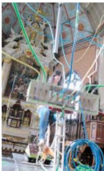
Le « vélo d'appart » : une usine à gaz et à sons.

panel d'une cinquantaine d'instruments. L'expérience est surprenante mais conseillée : « il faut que le public essaie, encourage l'ancien ébéniste. Allez-y, n'ayez pas peur, c'est prévu pour ! ».