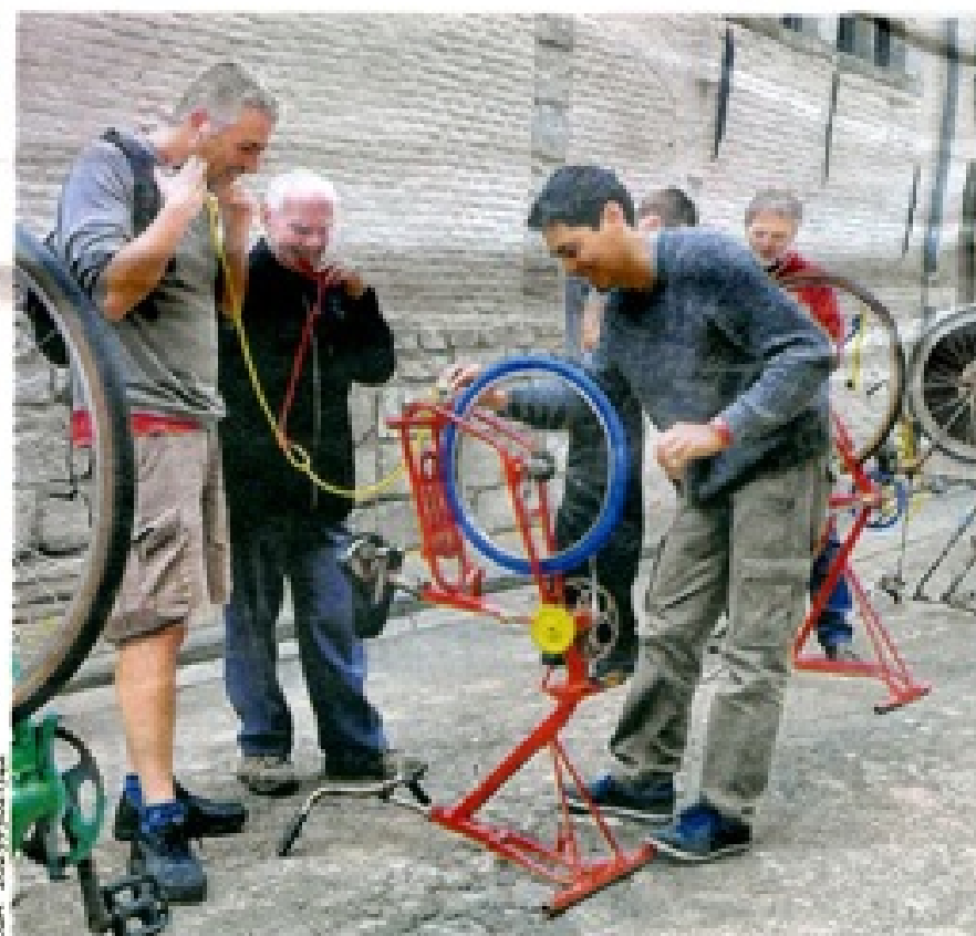
Écouter les entrailles... d'un « cyclophone »... au stéthoscope.

Autre attraction des portes ouvertes de la dynamique maison de jeunes : l'expo Sainte-Marguerite. Ici, c'est quelque chose de tout simple, mais pile-poil ce qu'il faut pour se faire une idée à propos d'un des sujets du moment en ville. On commence par des planches de Pasquier Grenier, on poursuit avec les photos prises avant et en cours de chantier, ainsi