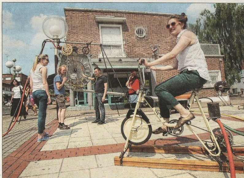
Pédaler pour faire du bruit. De drôles de « vielos » que l'on peut voir place des Nations.