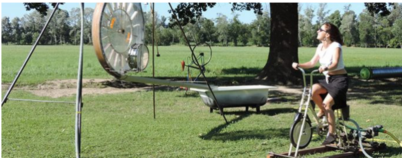
Instalația sonoră Ciclofonii / Les Espaces Cyclophones / François Cys (Belgia).

4-Oct-2018 / Actualitate / Teatrul Luceafărul blog