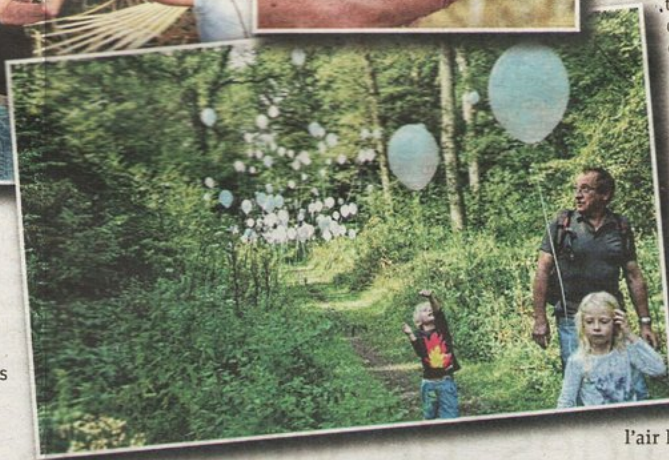
Transmission des savoirs en la machine à feu de Bernissart : en avant, les cigognes ! Déjà, sur les sentiers, on espérait l'éclosion de dragons.

En suspension, les marcheurs lisent entre les lignes du silence et poursuivent leur avancée résolue. Un gigantesque cocon leur fait signe : les œufs des parents dragons s'en sont échappés. Tout est possible, à condition de mobiliser les énergies belles, de repérer les éléments prometteurs.