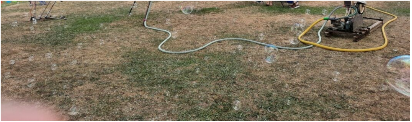
Installation sonore interactive Cyclophone réalisée à base de vélos par François Cys.